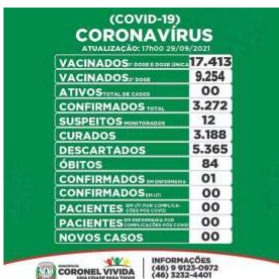
Figura 2: Informações sobre a situação da Covid-19 em Coronel Vivida