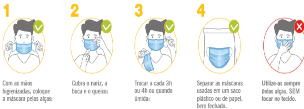
Figura 02 - Demonstração do manuseio correto das máscaras.

d) Se a condição de contágio da região se encontrar na fase vermelha, os professores e profissionais da educação devem utilizar protetor facial. Caso a condição se encontre em fase laranja ou inferior, o uso desse aparato é opcional aos servidores.