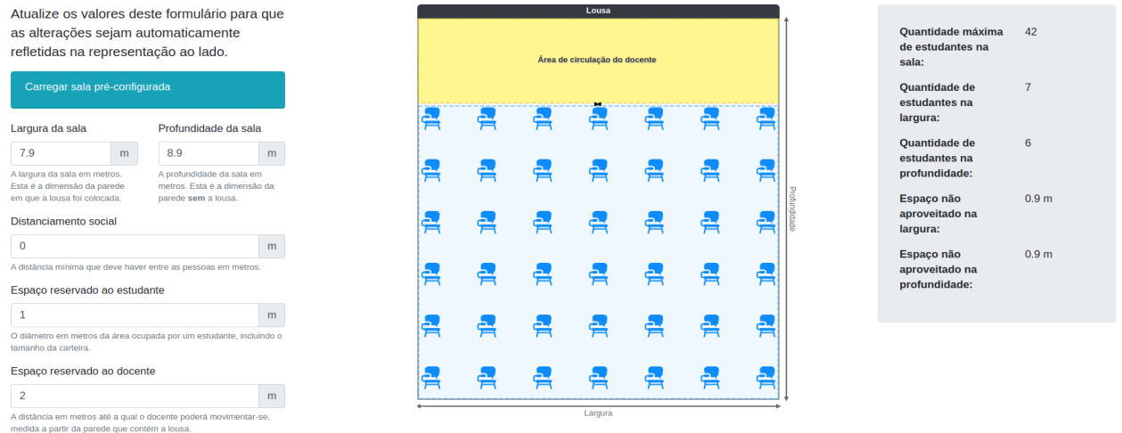
Figura 05 - Exemplo de organização para Fase 5 . (Imagem meramente ilustrativa)

considerando o comportamento cotidiano dos alunos e servidores, a situação epidemiológica local e institucional.