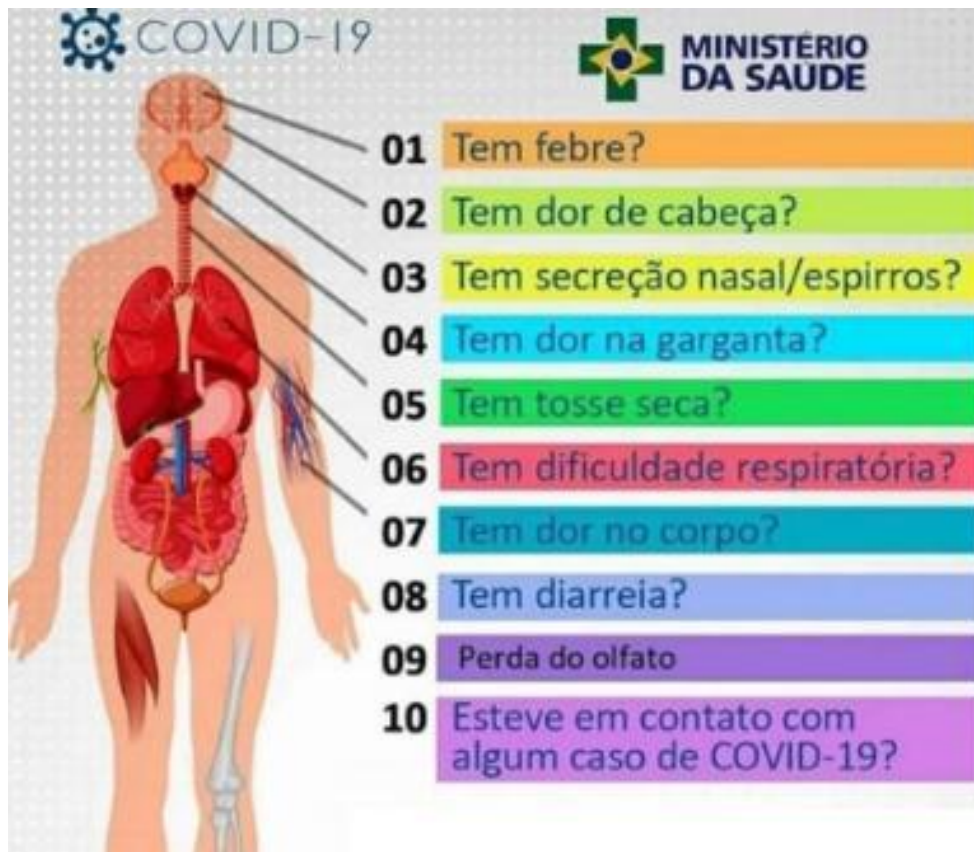
Figura 06 - Sintomas sugestivos de Covid19.

V - Qualquer membro da comunidade escolar que não estiver se sentindo bem, em relação aos sintomas especificados anteriormente, deve ficar em casa, informar a instituição, respeitando os fluxos indicados nos parágrafos II e III, e buscar uma UBS.