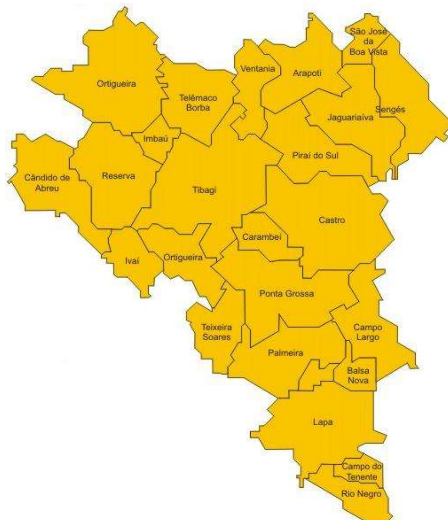
Figura 1: Região dos Campos Gerais – Paraná.

Sendo assim, dando continuidade ao processo de verticalização do ensino e com o intuito de oferecer cursos de graduação públicos e de qualidade, dentro do itinerário formativo do campus, foi apresentado o Projeto Pedagógico do Curso de Tecnologia em Análise e Desenvolvimento de Sistemas do Campus de Telêmaco Borba do Instituto Federal do Paraná, com duração de quatro anos e que atende o estabelecido na Lei de Diretrizes e Bases da Educação Nacional (LDBEN) (Lei 9.394/1996), nas Diretrizes Curriculares Nacionais Gerais para a Organização e o Funcionamento dos Cursos Superiores de Tecnologia (Resolução CNE/CP 3/2002), nas orientações gerais para os cursos superiores de tecnologia (Parecer CNE/CES 436/2001, Parecer CNE/CP 29/2002, Parecer CNE/CES 277/2006, Parecer CNE/CES 19/2008 e Parecer CNE/CES 239/2008), na Resolução CNE/CP 01/2012, na Resolução CNE/CP 02/2012 e no Catálogo Nacional de Cursos Superiores de Tecnologia. Além disso, está em consonância com o Plano de Desenvolvimento Institucional do IFPR (PDI), com a Resolução 55/2011 do Conselho Superior, com a Resolução 02/2013 do Conselho Superior, com a Portaria IFPR 120/2009 e com a Lei 11.892/2008.