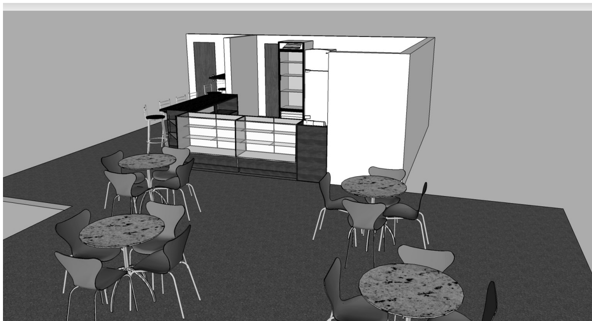
Figura 4: Visão Panorâmica Diagonal da Cantina

Figura 4 – A figura 4 mostra a visão panorâmica diagonal da cantina, apresentando a disposição mobiliária completa de todo o ambiente onde deverá ser instalada a cantina/lanchonete, valorizando a beleza e harmonia do local, demonstrando a facilidade do fluxo do público, bem como destacando os produtos a serem comercializados pelo cessionário no local.