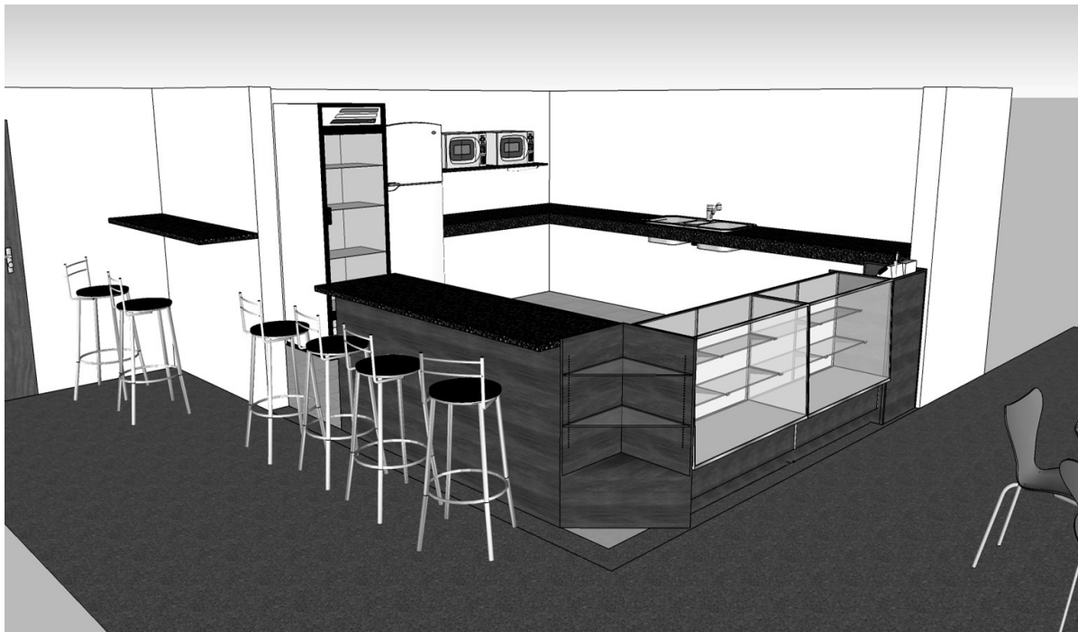
Figura 3: Vista Completa do Balcão da Cantina

Figura 3 – A figura 3 apresenta a vista completa do balcão para atendimento ao público, verifica-se além do balcão já descrito nas figuras 1 e 2, o interior da cantina, onde sugere-se a instalação de uma geladeira comum, de baixo consumo de energia elétrica, uma geladeira com porta de vidro para acondicionamento de bebidas e sucos conforme Edital desta concorrência, e dois fornos (elétrico e microondas) instalados sobre prateleira confeccionada em granito nas medidas condizentes com as medidas dos equipamentos e fixadas com segurança na parede interna da cantina e na altura ideal para o melhor manuseio dos equipamentos. Ainda no interior da cantina, conforme observa-se na figura 3 encontra-se instalada uma bancada lateral que serve como pia e balcão interno, este balcão não conta com portas inferiores ou outra proteção, que poderão ser instaladas caso o cessionário julgue necessário, ou o fiscal do contrato do IFPR – Câmpus Assis Chateaubriand o solicitar. Vale ressaltar que este balcão/pia de granito preto já encontra-se instalado no local.