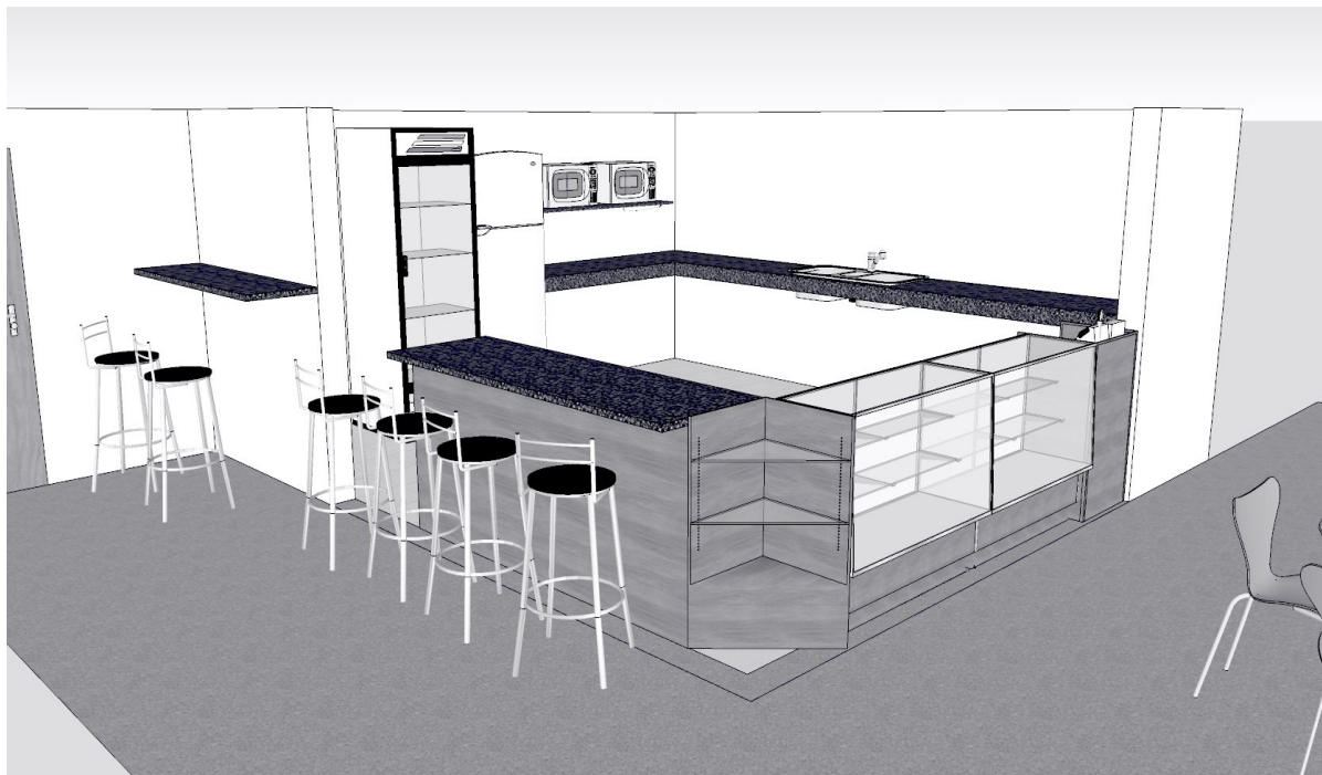
Figura 3: Vista Completa do Balcão da Cantina

Figura 3 – A figura 3 apresenta a vista completa do balcão para atendimento ao público, verifica-se além do balcão já descrito nas figuras 1 e 2, o interior da cantina, onde sugere-se a instalação de uma geladeira comum, de baixo consumo de energia elétrica, uma geladeira com porta de vidro para acondicionamento de bebidas e sucos conforme Edital desta concorrência, e dois fornos (elétrico e microondas) instalados sobre prateleira confeccionada em granito nas medidas condizentes com as medidas dos equipamentos e fixadas com segurança na parede interna da cantina e na altura ideal para o melhor manuseio dos equipamentos. Ainda no interior da cantina, conforme observa-se na figura 3 encontra-se instalada uma bancada lateral que serve como pia e balcão interno, este balcão não conta com portas inferiores ou outra proteção, que poderão ser instaladas caso o cessionário julgue necessário, ou o fiscal do contrato do IFPR – Câmpus Assis Chateaubriand o solicitar. Vale ressaltar que este balcão/pia de granito preto já encontra-se instalado no local.