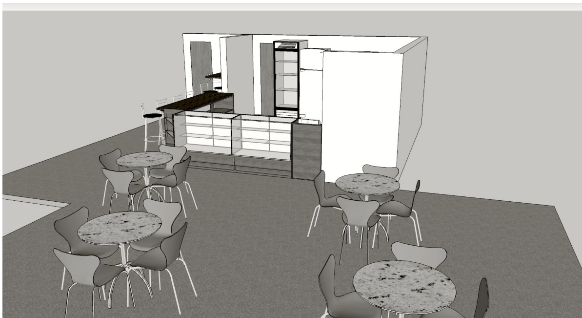
Figura 4: Visão Panorâmica Diagonal da Cantina

Figura 4 – A figura 4 mostra a visão panorâmica diagonal da cantina, apresentando a disposição mobiliária completa de todo o ambiente onde deverá ser instalada a cantina/lanchonete, valorizando a beleza e harmonia do local, demonstrando a facilidade do fluxo do público, bem como destacando os produtos a serem comercializados pelo cessionário no local.