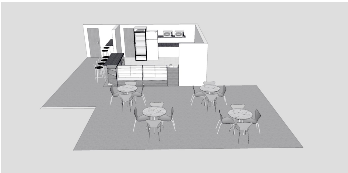
Figura 1: Vista Frontal da Disposição dos Móveis - “pátio frontal da Cantina”

A composição e disposição da mobília da cantina/lanchonete deverá ser conforme especificações abaixo e demonstrado nas figuras.