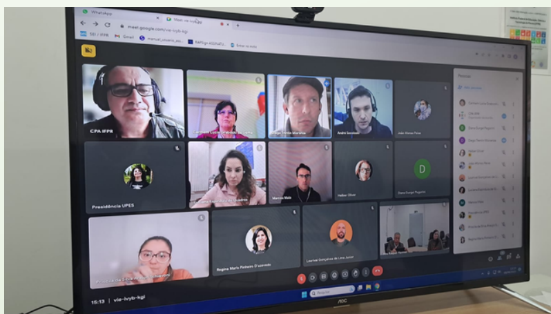
Imagem 1