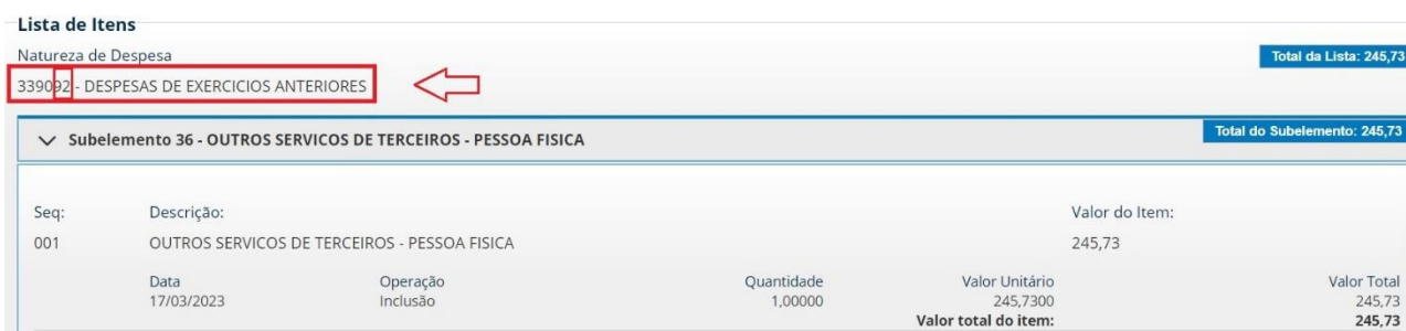
Figura 9 – Tela consulta CONNE (SIAFIWEB) – elemento 92

Quanto ao reconhecimento pela situação LPA303 (do exercício corrente), a classificação orçamentária será aquela normalmente utilizada para empenhos emitidos na execução do orçamento no exercício corrente.