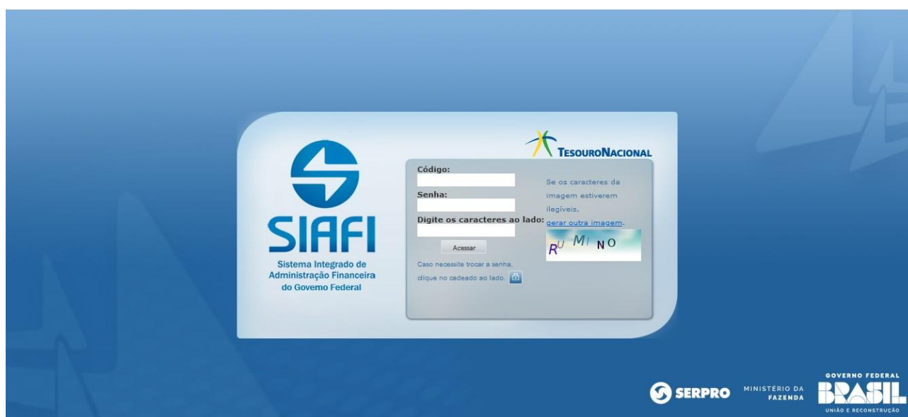
Figura 3 – SIAFIWEB – Tela inicial

O tipo de documento hábil (DH) a ser utilizado para o registro de reconhecimento de passivo é o tipo “ PA ”.