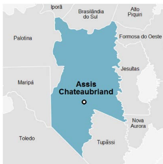
Figura 3 – Municípios Limites de Assis Chateaubriand

A região de Assis Chateaubriand destaca-se por sua sólida base agrícola, sendo reconhecida pela produção expressiva de grãos, como soja e milho, além da pecuária. A agricultura familiar desempenha um papel fundamental na região, contribuindo para a diversificação da produção agrícola com cultivos de hortaliças, frutas e outros alimentos. A atividade agrícola e o agronegócio exercem um impacto significativo na economia local, gerando empregos diretos e indiretos e impulsionando o desenvolvimento socioeconômico. Também têm impactos positivos na geração de divisas para a região, uma vez que a produção é destinada tanto para o mercado interno quanto para a exportação, contribuindo para a balança comercial do país.