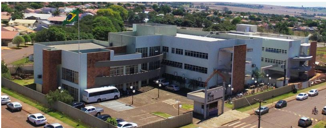
Figura 2 – Foto do IFPR Campus Assis Chateaubriand

Ainda nesta perspectiva de consolidação de sua participação na sociedade e expansão das ações para atender toda a região, em 2019, o IFPR Campus Assis Chateaubriand cumpre mais uma vez seu papel e assume a implantação de um Centro de Referência. Localizado dentro do Parque Científico e Tecnológico de Biociências (Biopark), um ecossistema de inovação na cidade de Toledo-PR, promove, além da formação técnica profissional e humana, o desenvolvimento e apoio aos arranjos produtivos locais, operacionalizando o Centro de Referência IFPR-BIOPARK, um local avançado de trabalho com a oferta de cursos em todos os níveis e que realiza diversas parcerias para desenvolvimento de pesquisa e inovação.